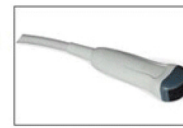
MC6-A 6.0MHz Micro-Convex