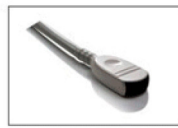
MC5V-A 5.0 MHz Micro-Convex